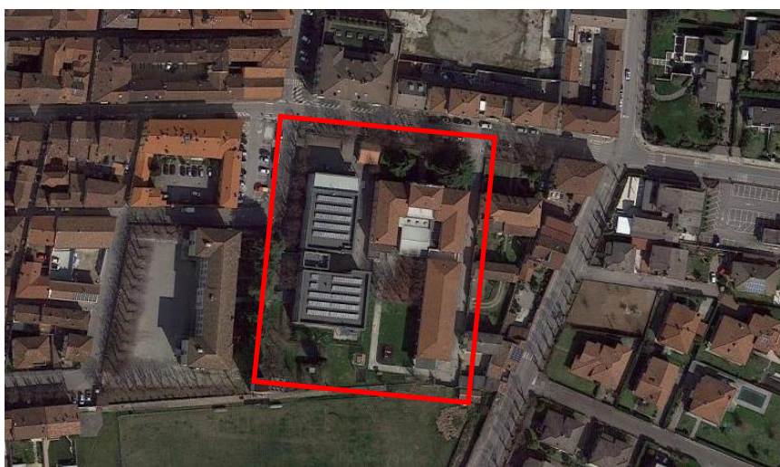
Aula polifunzionale Istituto Comprensivo Orzinuovi – Via Mazzini