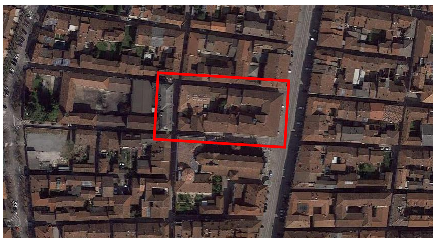
Centro Culturale “Aldo Moro” – Via Palestro

Sulle planimetrie di pagina seguente sono evidenziati i percorsi di ingresso e di uscita dalle sedi.