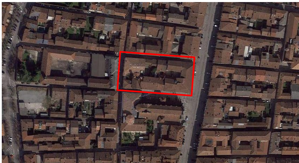
Orto-foto dell'area interessata – Centro Culturale “Aldo Moro” via Palestro, 17

I servizi di informazione e accoglienza saranno a cura dell'organizzatore. L'accoglienza, prevederà, inoltre la disponibilità di unità specifiche preposte. Il personale garantirà l'accesso contingentato. I servizi di sicurezza, custodia e guardiania saranno a cura del soggetto organizzatore. Il rilevamento della temperatura corporea oltre al controllo del certificato verde (Green Pass) sarà previsto in corrispondenza dell'ingresso predisposto per l'accesso dei candidati. Tutte le sedute saranno posizionate in modo tale da garantire una distanza minima di 2,25 m tra i partecipanti. Gli stessi dovranno, obbligatoriamente, indossare la mascherina per tutta la durata della prova e sanificare spesso le mani.