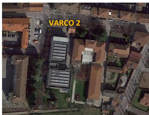
Ortofoto con varchi di emergenza

Ogni varco sarà analizzato singolarmente