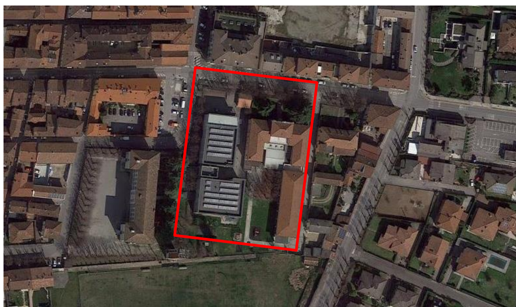
Orto-foto dell'area interessata – aula polifunzionale Istituto Comprensivo di Orzinuovi – via Mazzini